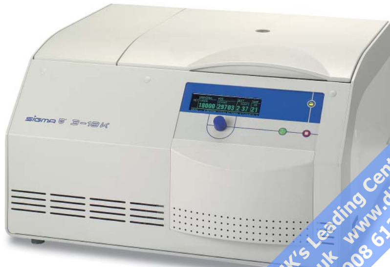
Tischkühlzentrifuge Refrigerated Centrifuge