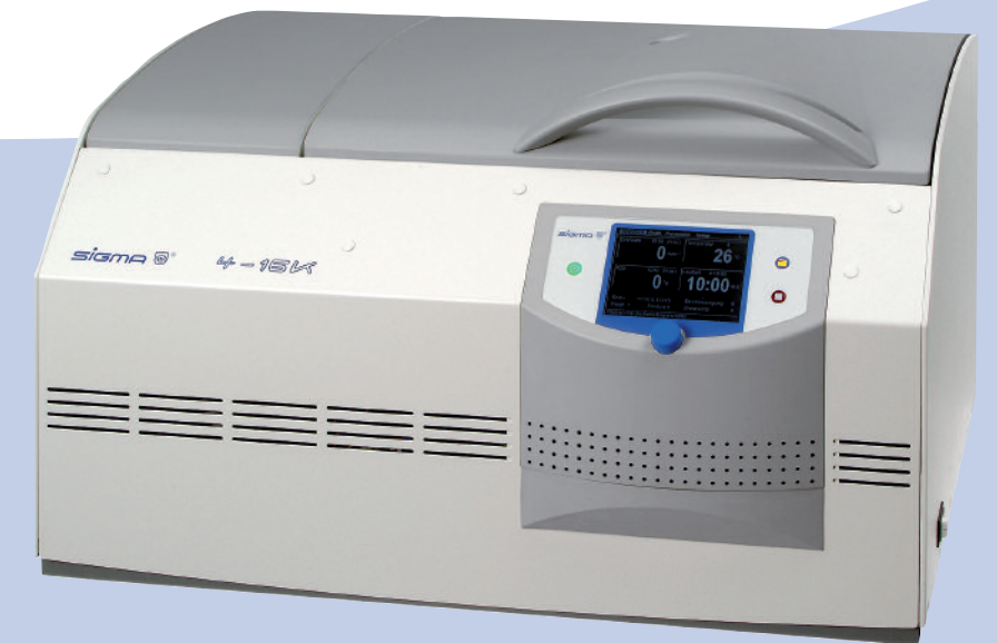
Tischkühlzentrifuge Refrigerated Centrifuge